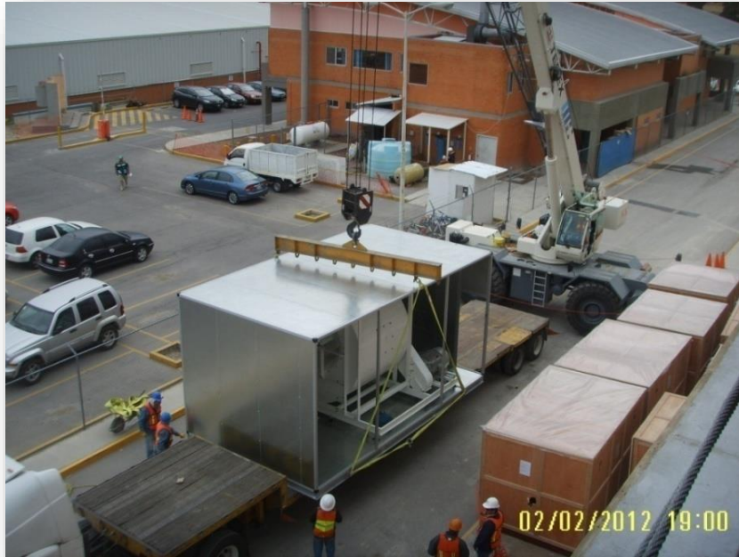
Preparación para hizaje de Módulo VEI