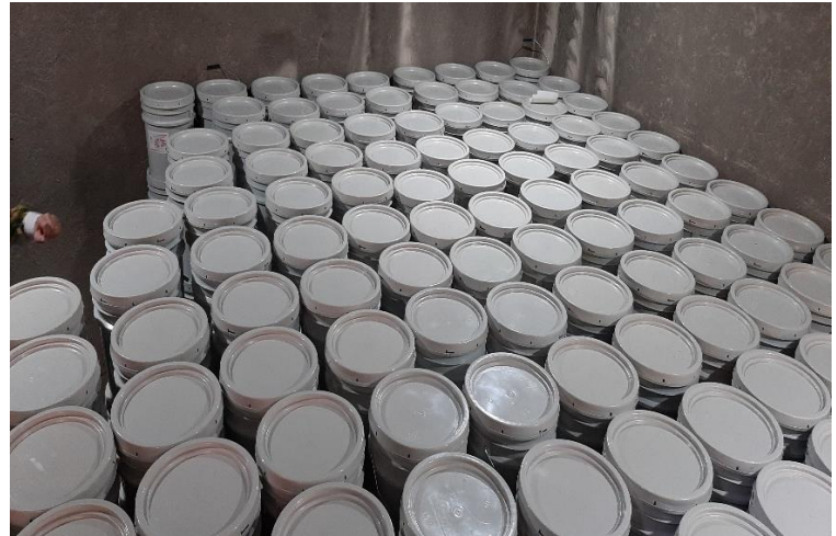
Almacén de producto listo para envío