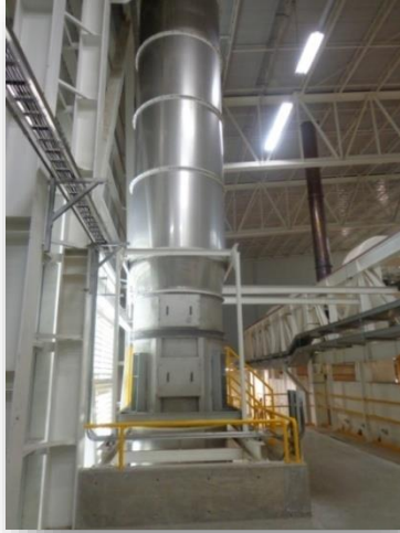
Chimenea de extracción con Ventilador axial (160,000 m 3 /hr)