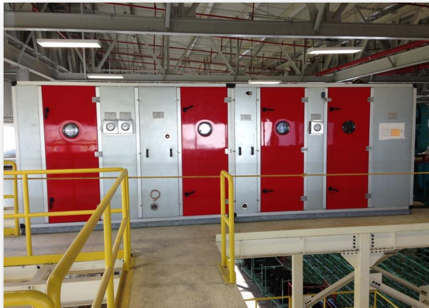
UMA instalada en Honda, Celaya