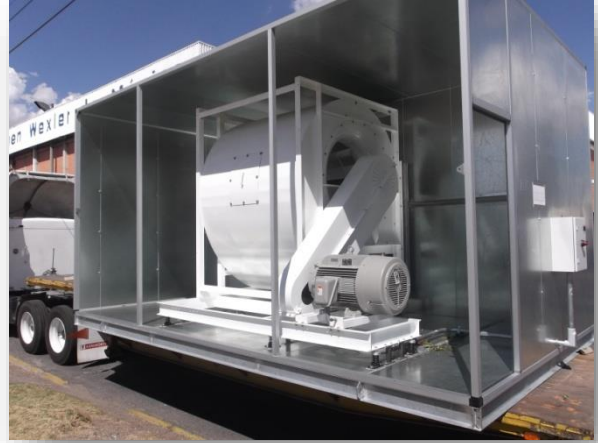
Ventilador con motor de 125 HP