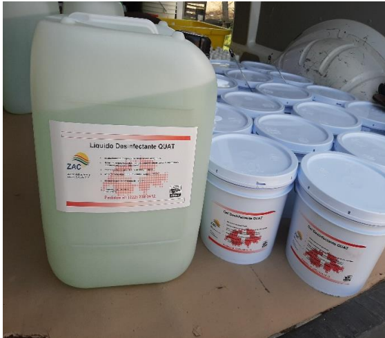
Presentación de Liquido y Gel Desinfectante QUAT

El 06 de enero del 2020 celebramos la colaboración con la empresa ZAC (Zurich Adhesivos y Ceras, S. A. de C.V.) para poder elaborar y comercializar el “GEL DESINFECTANTE QUAT”, el “LIQUIDO DESINFECTANTE QUAT” y el “LIQUIDO DESINFECTANTE QUAT CONCENTRADO”, productos hoy día necesarios para la sanitización de personas y comercios.