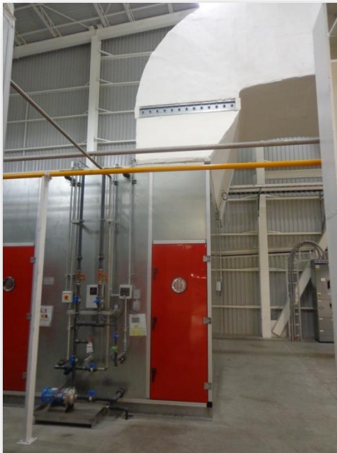
Bomba para humidificación