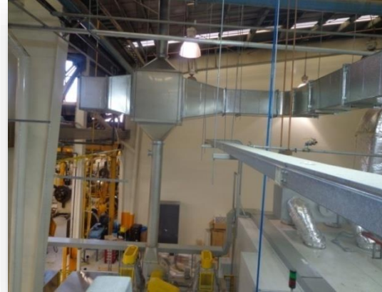
Intercambiador de calor Aire / Aire en inoxidable