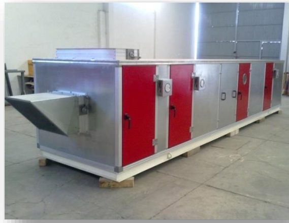
SCP-13 para uso Fármaco