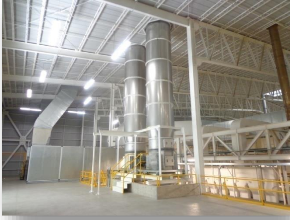
Las 2 chimeneas en operación