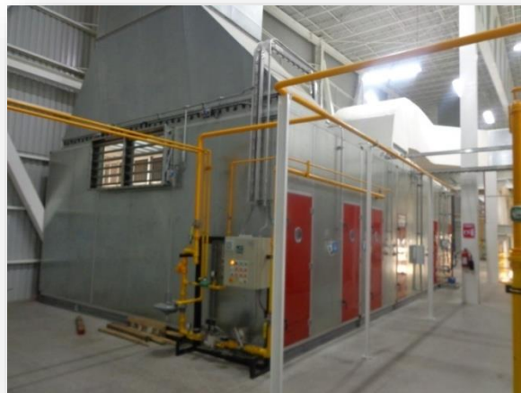
Vista de UMA (160,000 m 3 /hr) con tablero de control de gas